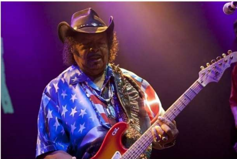
Guitar Shorty v Lucerna Music Baru

Do pražského Lucerna Music Baru přivezla agentura Liver music v rámci Prague International Bluenight s číslem 107 významného bluesového kytaristu Guitar Shortyho. Jak hudebník pojal svůj koncert v sedmdesáti čtyřech letech a jestli se projeví znaky hendrixovské hry na kytaru, se dočtete níže.