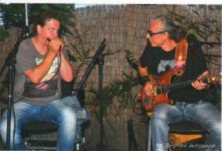
Cielak & Coolish Makaron & Rajca