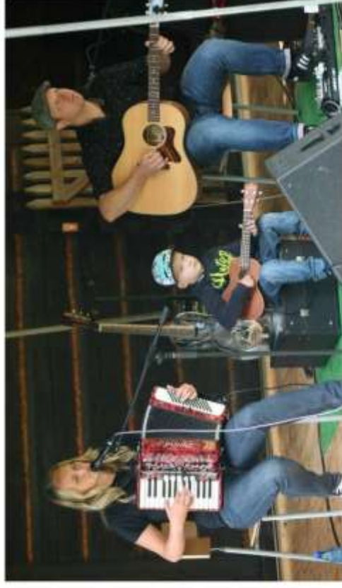
Front Porch Blues czyli... Lauba Pełno Bluesa w Chorzowie.

Od 7 do 9 sierpnia 2015 roku Front Porch Blues w chorzowskich obiektach.