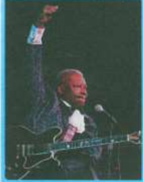
44 HUDA 1-1 Q AWX

PRIE B. B. KINGA A DR. JOHNA B. HENRIEHO z Los Angeles udeľovali už po jedenásťročný najprestížnejšie americké hudobné ceny Grammy. Tak ako prú iné roky, medri množstvom hudobných kategórií nedýchala ani blues. Kategória uznávača 06 niosa názov Najlepší album tradičného blues. Nominovaný bol 5 albumov, s ktorých víťazom cena, zlatý gramofónik, si odovzda legendárny