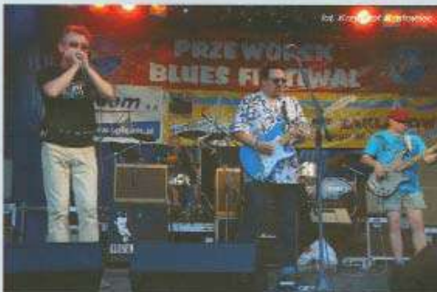
Los Agentes & Hokus